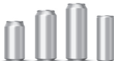
Standard 33 cl Standard 44 cl Standard 50 cl Sleek 33 cl

Die Mindestabnahmemenge beträgt 500 Liter, entsprechend 1'000 Dosen à 50 cl oder 1'500 Dosen à 33 cl.